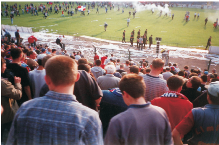
Zadyma na stadionie

„My - przeciw innym” – to jeden z fundamentów konfliktów między ludźmi. Spory nie odnoszą się tylko do osób dojrzałych, ale coraz częściej także i do młodzieży. Czego dotyczą kłótnie nastolatków? Okazuje się, że najczęściej owe nieporozumienia są powiązane ze sportem – piłką nożną - a ściślej mówiąc,