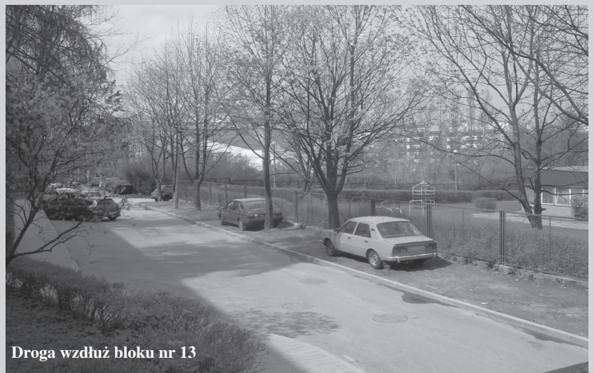
Droga wzdłuż bloku nr 13